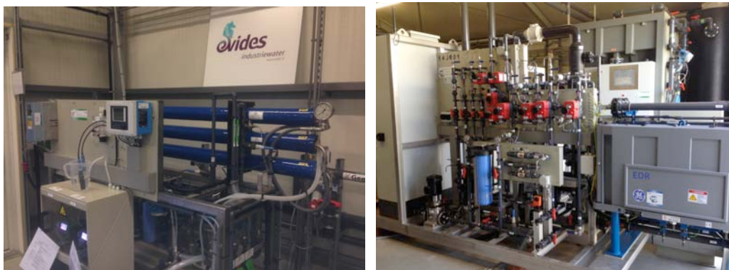
Afbeelding 3. Pilotopstelling nanofiltratie (links) en electrodialysis reversal (rechts)

In verband met variaties in voedingwatersamenstelling moeten enigszins conservatieve waarden worden aangehouden voor de te behalen recoveries. Voor spui- en bioxwater zijn recoveries van 75% reëel, voor koeltorenspuiwater 58%.